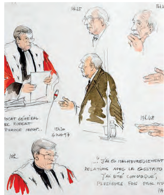
Le procès Papon, Palais de justice de Bordeaux, 1997. Crayon à papier et aquarelle, 32 x 41cm.