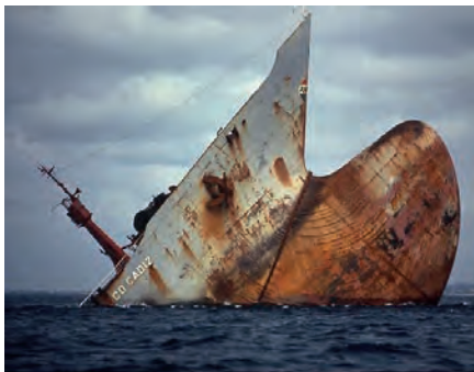
Proue de l'Amoco-Cadiz, Portsall, 1978

D'autres contenus pourront s'appuyer sur les évolutions des pratiques concernant, par exemple :