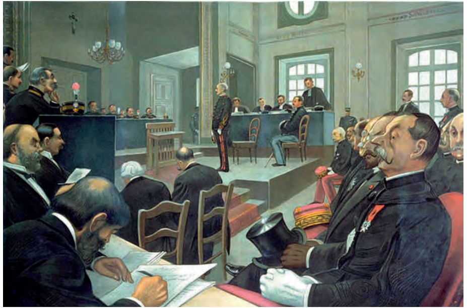
Le second procès Dreyfus en 1898, à Rennes.

Des ateliers avec des médiateurs, des Dimoitou sur la justice, permettront de développer un rôle éducatif à destination des enfants pour expliquer sous forme attrayante le fonctionnement de la justice