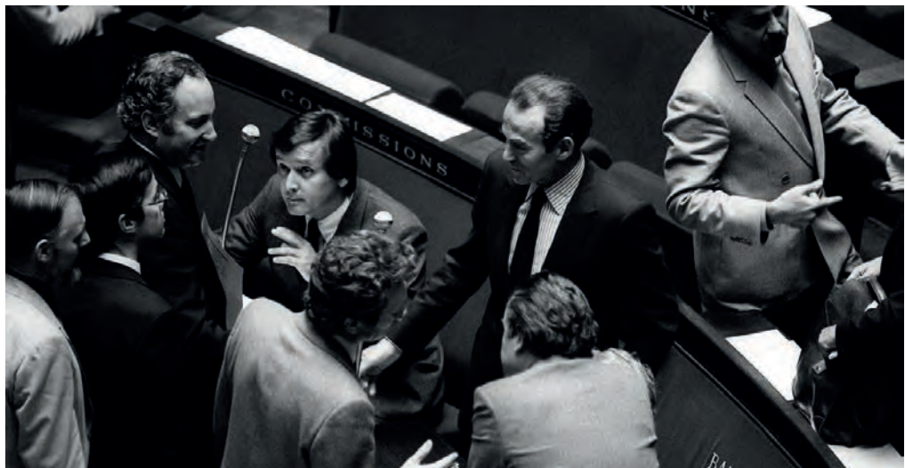
Robert Badinter à l'Assemblée nationale, le 17 septembre 1981 à Paris, après l'examen de son projet de loi sur l'abolition de la peine de mort.